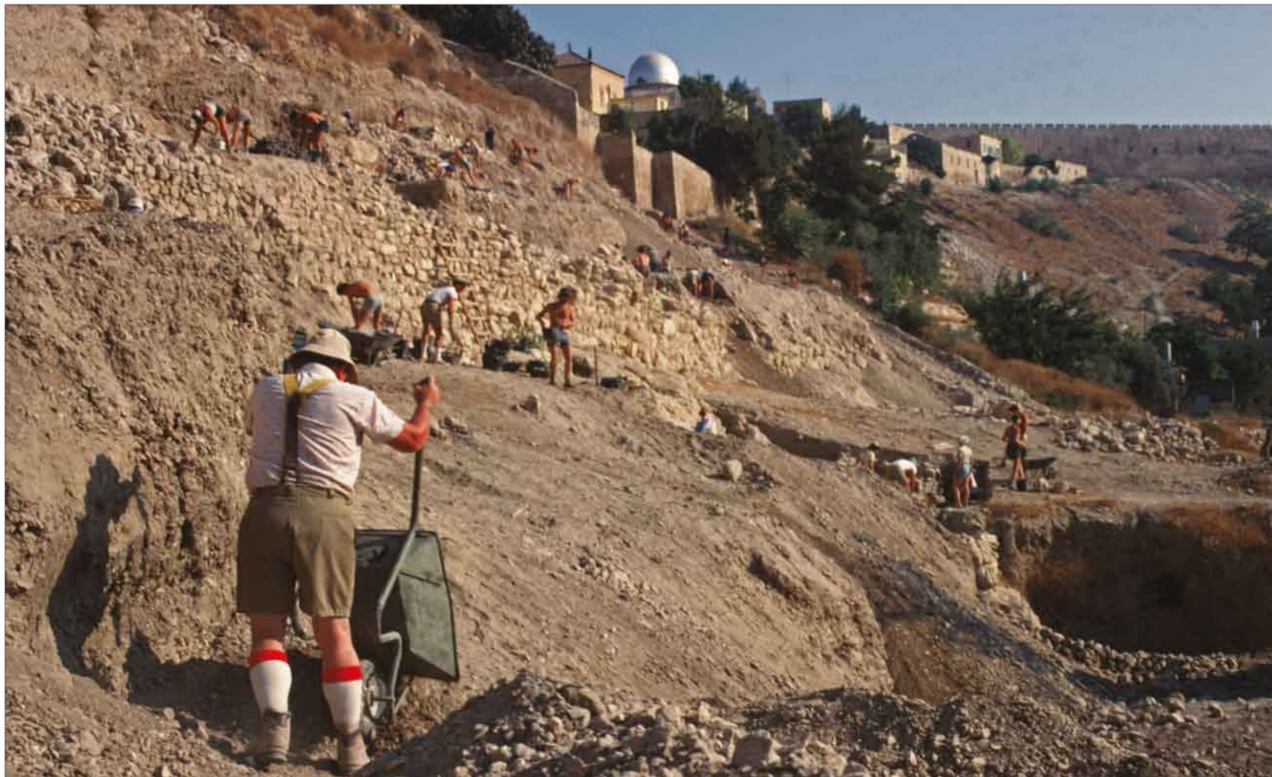
איור 3. חפירת המדרון המזרחי ע"י משלחת שילה.