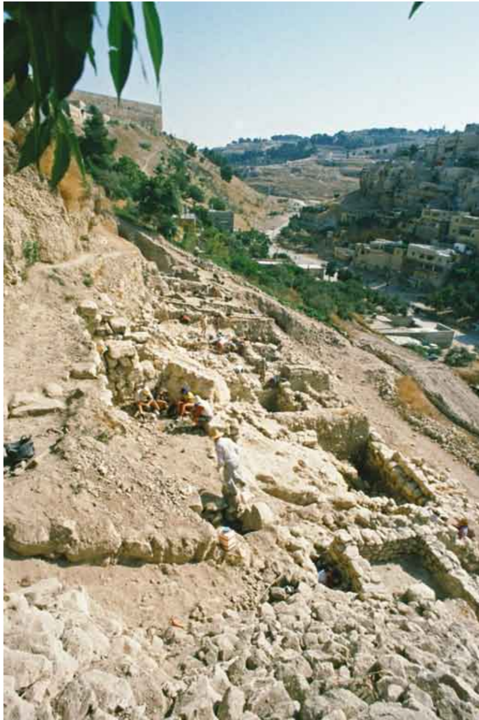
איור 4. חפירת המדרון המזרחי ע"י משלחת שילה.

המזרחי של ירושלים (גרוסברג תשנ"ט, תשס"ד-ב).