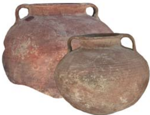
איור 3. סירי בישול תמימים שנמצאו בתוך תעלת הניקוז שמתחת לרחוב המדורג

בעקבות ניקוי תעלת הניקוז נחפר קטע מן הרחוב המרוצף שהובחן מעל התעלה. העבודה החלה