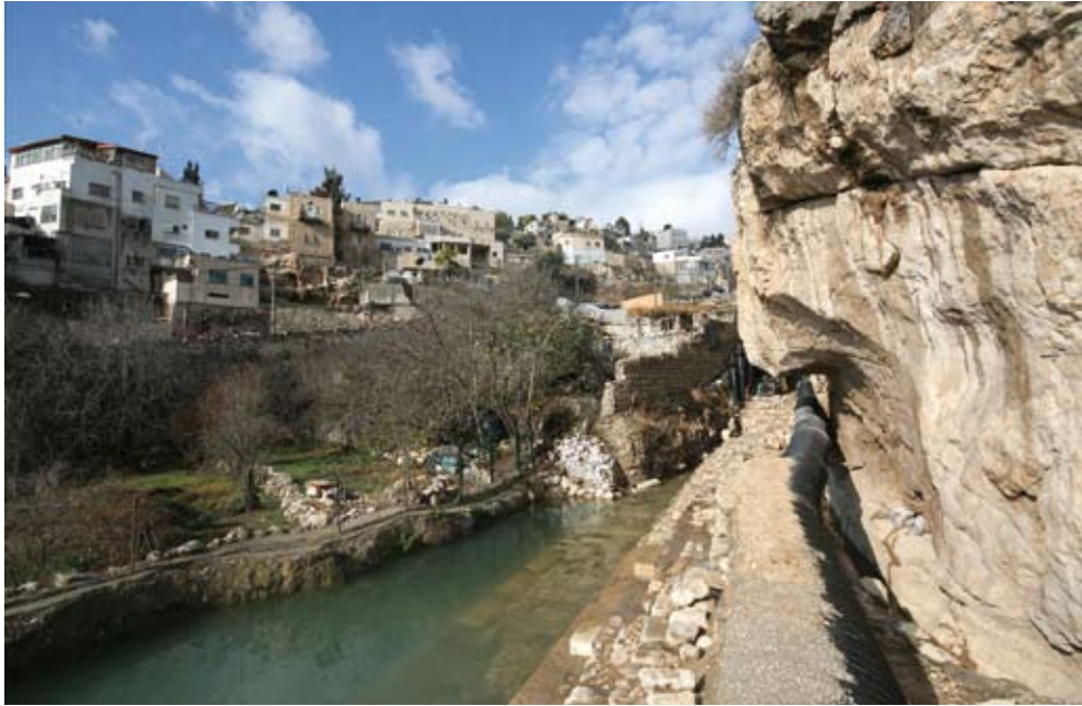
איור 1. בריכת השילוח, כשהיא מוצפת במים, מבט לצפון-מערב

על חשיפתה של בריכה מדורגת ומדופנת אבני גזית בחלקו הדרומי של עמק הטירופויון, אותה זיהינו עם בריכת השילוח של ימי הבית השני, דיווחנו בעבר (רייך ושוקרון תשמ"ה). מאז, המשכנו את חפירותינו באזור הציבורי שמצפון לאותה בריכה, וכך נחשפו חלקים ניכרים של רחבה מרוצפת לוחות אבן (רייך ושוקרון -2006א).