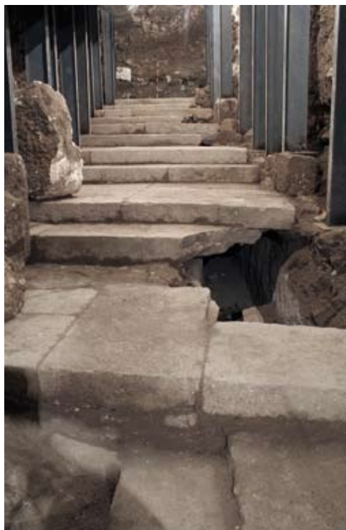
איור 7. רחוב מרוצף לוחות אבן, מדורג. שימו לב לפרצות בלוחות האבן הנפתחות אל תעלת הניקוז. מבט לצפון