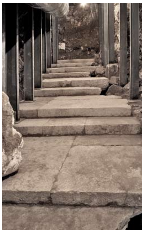
איור 4. רחוב מרוצף לוחות אבן, מדורג. שימו לב לפרצות בלוחות האבן הנפתחות אל תעלת הניקוז. מבט לצפון

נחשף קטע צר וארוך של רחוב מדורג, המרוצף בלוחות אבן גדולים, מונחים בקפידה, מן הסוג שמוכר כבר בקטע המערבי ביותר של הרחבה (שנתגלה בשלהי המאה התשע-עשרה בידי בליס ודיקי, 1898: 132-177, לוחות V, XVI). בחפירה הנוכחית חשפנו שלושים מדרגות, מסודרות באותו קצב שהבחינו בו בעבר בליס ודיקי בצד המערבי, כלומר של מדרגה רחבת שלח ומדרגה צרת שלח לסירוגין. צורה זו