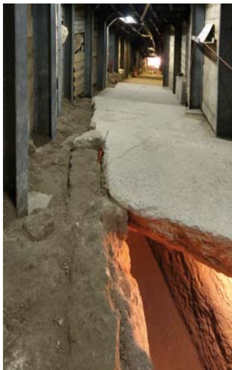
איור 8. רחוב מדורג ותעלת ניקוז מתחתיו. מבט לדרום.

”עוד צל תקווה נשאר לעריצים ולחבר השודדים אשר אתם, כי יעלה בידם להימלט דרך המנהרות: הם בטחו, כי לא יוכלו הרומאים למצאם בבורחם שמה, ואמרו בנפשם להתחבא שם, עד אשר יחריבו הרומאים את העיר כליל ויסורו מעליה, ואז יוכלו גם הם להימלט על נפשם. אולם תקוותם זאת הייתה חלום, כי לא נגזר עליהם להסתר מעיני האלוהים וגם מעיני הרומאים. אך עד בוא פקודתם בטחו במחסה הנחבות אשר מתחת לאדמה” (מלחמת היהודים ו ז ג. כל הציטוטים להלן מתוך תרגומו של י”נ שמחוני).