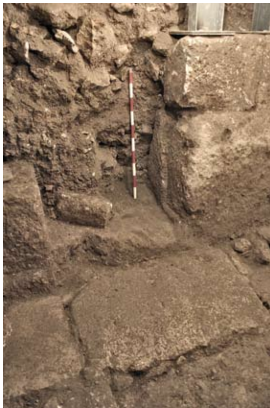
איור 6. פתח לחנות, הנפתחת לרחוב המדורג. תוכנה של החנות לא נחפר

בקטע הדרומי של הרחוב, ניתן להבחין שהוא צמוד ממש למצוק הסלע של גבעת 'עיר דוד'. יתר על כן, אל תוך הסלע חצובים זה בצד זה, שני מרווחים מלבניים. אלה הם ודאי פתחים המוליכים אל שתי חנויות שהיו ממוקמות בצד הרחוב. המרווח שמאחורי פתחים אלה מלא במפולות אבן ועפר ולפי שעה לא נחפר תוכן של החנויות.