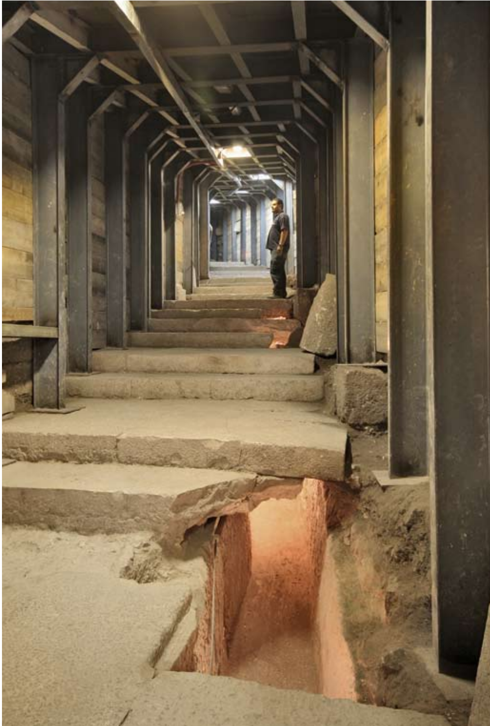
איור 9. רחוב מדורג עם פרצה אל תעלת הניקוז, מבט לצפון