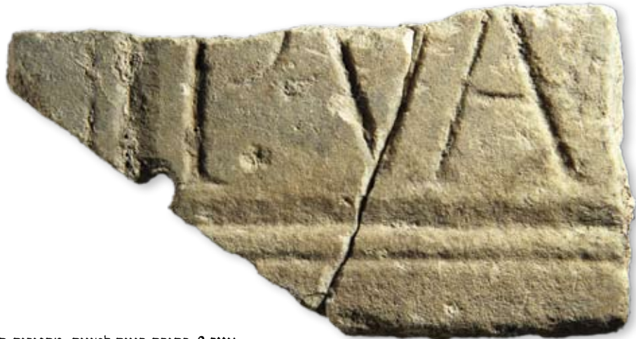
איור 9. כתובת בנייה לטינית, מחפירות חניון גבעתי

הכתובת התגלתה באחד מקירות בתי התקופה המוסלמית הקדומה עת נעשה בה שימוש משני כאבן בנייה זמינה. מאחר שהתגלתה שלא באתרה אין בידינו לקבוע את מקומה המקורי, או לקשור בינה ובין המבנה הרומי הנחשף בחניון גבעתי. אומדן זהיר של מימדיה (במיוחד לנוכח גודלן של האותיות) מלמד שלפנינו כתובת מונומנטאלית שהתנוססה על אחד מבנייניה החשובים של העיר הרומית.