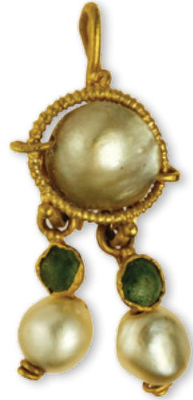
איור 5. עגיל זהב משובץ פנינים ואבני ברקת, מחפירות חניון גבעתי

העגיל עשוי חישוק זהב, מלופף ומשובץ במרכזו בפנינה גדולה. אל החישוק מחוברים שני תליוני זהב זהים, המעוטרים כל אחד באבן ברקת (אזמרגד) ובפנינה. אבן הברקת אחוזה במעין כיפת זהב, המחברת אותה אל החישוק המרכזי בעזרתו של חישוק קטן, עשוי אף הוא זהב. אל אבן הברקת קשורה מצידה האחר פנינה נוספת, קטנה ביחס לזו המשובצת בחישוק העליון. הפנינה מחוברת אל אבן הברקת בעזרתו של מחבר זהב העובר דרך קדח זעיר שנקדח בה.