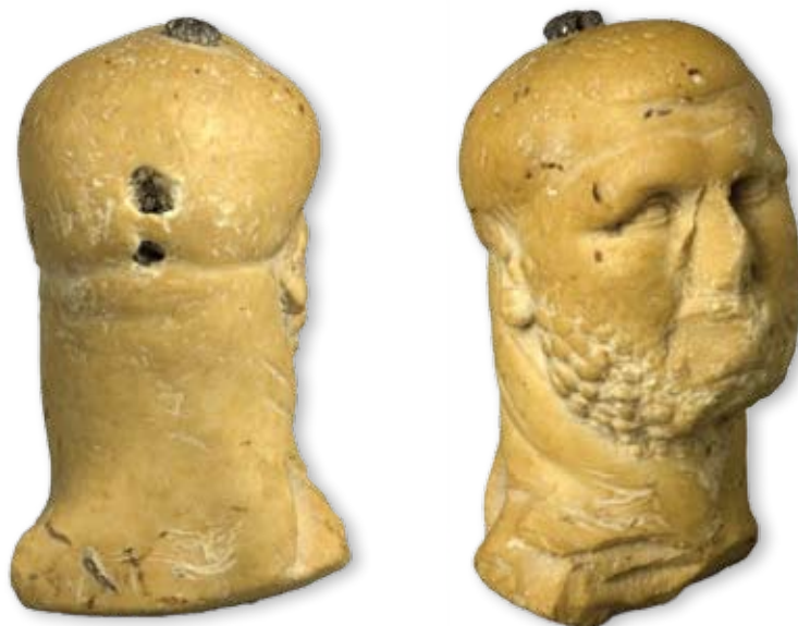
איור 3+4. פרוטומה של ראש גבר מזוקן (פנים ואחור), מחפירות חניון גבעתי

והמסולסל כמו גם תנוחת ראשו הנוטה קלות לצד ימין מעידים על השפעה יוונית ברורה המלמדת שיש לקבוע את תאריכו לימיו של הקיסר הדריאנוס או לפרק זמן לא רב אחריו (מאות שנייה-שלישית לסה"נ) - אחת מתקופות השיא של אומנות הפיסול הרומי. הגוון הצהבהב של השיש מרמז על מקורו המזרחי של חומר הגלם ממנו גולף הדיוקן, ככל הנראה אזור אסיה הקטנה, אף כי עניין זה עדיין טעון בדיקה.