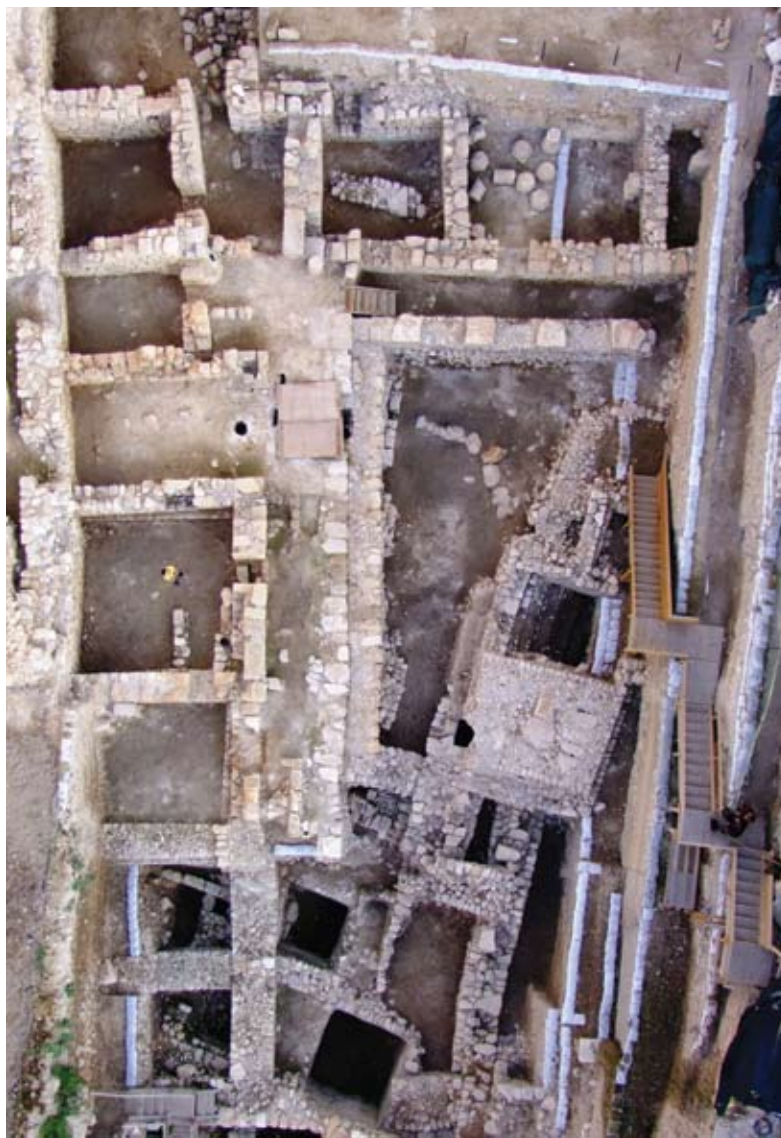
איור 1. המבנה מהתקופה הרומית בחניון גבעתי, מבט כללי

שני מאגרי מים תת-קרקעיים היו משולבים בחצר הפריסטילית. קירותיהם טויחו במספר שכבות של טיח הידראולי. הם קורו באמצעות לוחות אבן גדולים שהונחו על גבי סדרה של קשתות עשויות אבן אף הן.