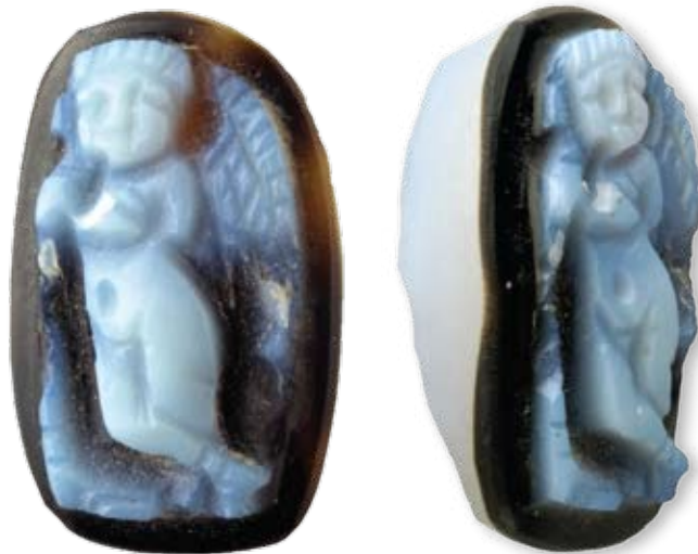
איור 6+7. גמה (cameo) נושאת את דמותו של קופידון, מחפירות חניון גבעתי

צידה האחד הקמור היה זה שהוכנס אל תוך מסגרת המתכת של תכשיט שבו שובצה האבן, ככל הנראה טבעת או עגיל (הניג 1990: 51, 61-62). צידה האחר השטוח היה צד החזית הנראה לעין. הדמות מוצגת במלואה כשהיא עומדת ורגליה משוכלות. ראשו של קופידון פונה קמעה שמאלה, סנטרו נשען על ידו הימנית. ידו השמאלית מונחת על לפיד הפוך המסמל את חדלון החיים. נוצות כנפיו מרומזות על-ידי מספר חריטות. הכנף הימנית מוסתרת מאחורי גופו. פניו עגולות ומלאות ושערו מתולתל.