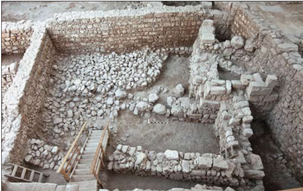
איור 3. מערום האבנים הגדול (תקופת הברזל?) מתחת לשרידי בנייני התקופה ההלניסטית והרומית. מבט לצפון.

המכלול הקרמי שמקורו בקדום מבין שלביה של תקופת הברזל עשיר ומגוון ומעיד כי יש לתארו קודם למאה השמינית לפסה"נ. קביעה זו נשענת בעיקרה על הטיפוסים הקראמיים השכיחים בו אך בה במידה גם על היעדרותם המוחלטת של אותם טיפוסים המאפיינים במובהק את שלביה המאוחרים של התקופה (בן עמי 2011).