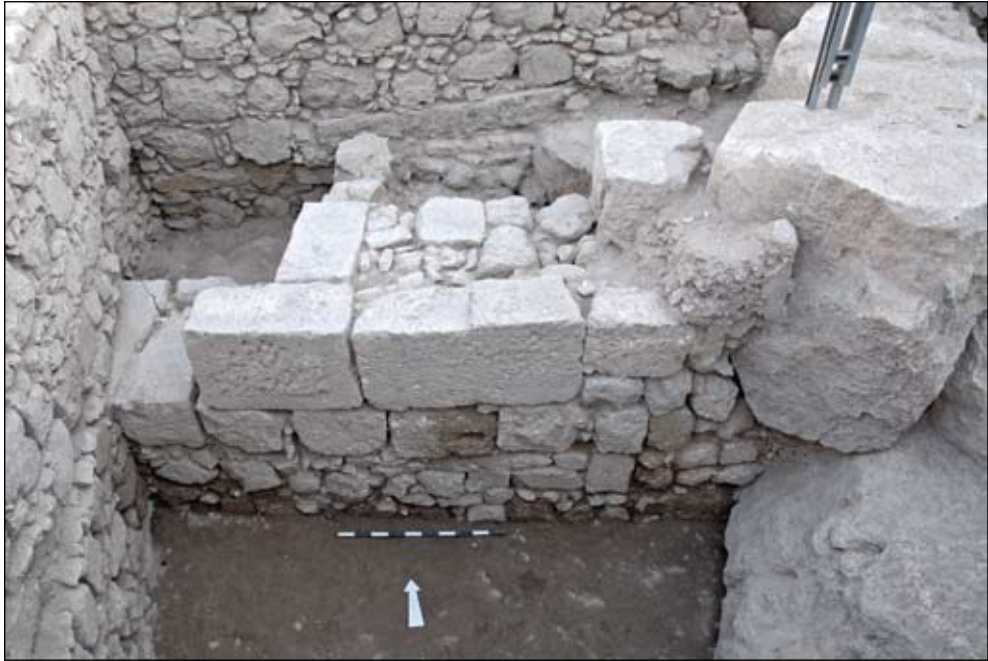
איור 4. צידו המזרחי של פתח הכניסה למבנה החשמונאי. יסודות המבנה מן התקופה הרומית המאוחרת מושתתים מעליו. מבט לצפון.

המאוחרת. בחלקו הצפוני, במקום שבו השתמר הסלע לגובה ניכר, חצבו בנאי התקופה חדרים שאותם שילבו כחלק אינטגרלי של המבנה הנדון. אולמות מוארכים השתרעו ממערב לכניסה ורצפותיהם עשויות טיח לבן. עד כה נחפרו שניים מאולמות אלה. תחילתו של מרחב נוסף מתחילה להתגלות מדרום (מתוכנן להיחפר בעתיד). הקיר החוצץ בין שני האולמות שנחפרו נשדד בעת העתיקה.