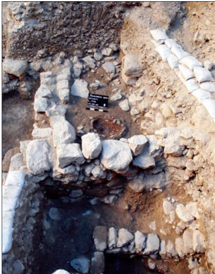
איור 2. מבנים מתקופת הברזל בצידו הדרום-מזרחי של שטח החפירה. מבט לצפון.

עד כה נחשפו שרידיה של תקופת הברזל בשטח מצומצם למדי, בפינתו הדרום-מזרחית של חניון גבעתי, אך די בהם כדי ללמד על קיומה של התיישבות אינטנסיבית במקום לאורך רוב התקופה. אלה כוללים שרידי מבנים שבנייתם דלה ובלתי מוקפדת, שבהם נתגלו מתקנים מסוגים שונים (איור 2).