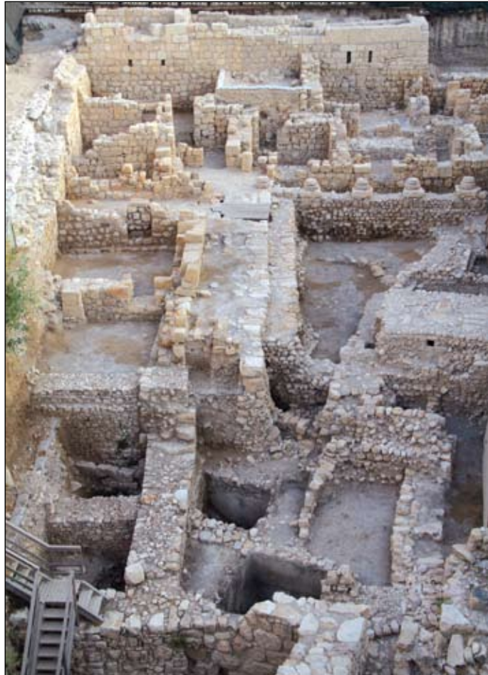
איור 6. אגפו המערבי של המבנה הפריסטיילי מן התקופה הרומית המאוחרת. ברקע - המבנה מן התקופה הביזנטית. מבט לצפון.

לשם הקמתו של מבנה כה גדול לאורך מדרונו המזרחי של הטירופיון נדרשו אדריכליו לפתרונות הנדסיים יצירתיים. את צידו המזרחי, הקימו ישירות על הסלע שהיה גבוה בצידה זה של הגבעה. אולם מאחר והסלע צונח חדות מערבה, נוצר כשל טופוגרפי עליו התגברו הבנאים הרומיים באמצעותה של קומת קרקע ששולבה בצידו המערבי (איור 6). יוצא אפוא, שקומת המגורים העיקרית השתרעה על פני מפלס אחד. בצידו המזרחי נתגלתה עד כה שורה של שלושה חדרים שרצפתו של אחד מהם היא רצפת פסיפס הכוללת במרכזה מסגרת מלבנית בגוני שחור ואדום. חדר זה נפתח כלפי חדר מבואה שהיה חצוב בסלע ואליו הוליכה דרך שירות מרוצפת. חצר רחבת ידיים נוספת השתרעה ממערב לשורת החדרים הנדונה ונועדה ככל הנראה למתן את העומסים על חלקו זה של המבנה, במקום שבו צונח המדרון בחדות מערבה.