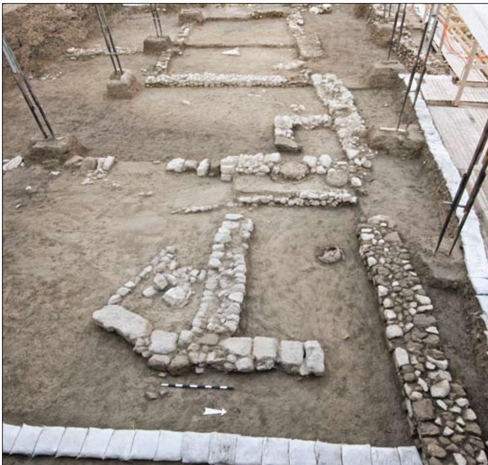
איור 7. חלק מאזור מלאכה מן התקופה העבאסית. מימין - אחת הסמטאות ביישוב העבאסי (תחומה בין שני קירות אורכיים). מבט למערב.

התקופה המוסלמית הקדומה זוכה לייצוג משמעותי בכל שטח החפירה. היא כוללת מספר שכבות יישוב המעידות על רציפות היישוב במקום החל מן התקופה האומיית ועד לשלהי התקופה העבאסית. תוצאות החפירות האחרונות הוסיפו נתונים חדשים על תפוסת היישוב העבאסי, אופיו ותוכניתו. יחד עם הנתונים הקודמים מצטיירת כעת תמונה של יישוב מתוכנן הכולל שטחים פתוחים, שטחים בנויים שנועדו למלאכה זעירה, מתקנים מסוגים שונים, בורות מים, בורות ספיגה ומערכת של סמטאות (איור 8). יישוב זה בנוי על שרידיו של שוק שבו נמכרו כלי חרס, כלי עצם, פירות, מיני קטניות, בשר, ביצים, דגים ועוד (ראו בעניין זה - בן עמי וצ'חנובץ 2008).