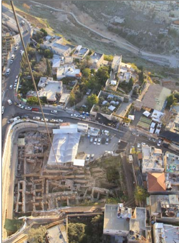
איור 1. חניון גבעתי 2012. ברקע - נחל קדרון. מבט למזרח.

מאז חודש מרץ של שנת 2007 ועד היום מתנהלות באופן רציף חפירות מטעם רשות העתיקות בשטח החניון של עיר דוד המוכר בכינויו 'חניון גבעתי'. שטח החפירות משתרע על פני 5 דונם לערך ונתון זה ממקם אותו בין שטחי החפירה הגדולים ביותר שנחפרו עד כה בגבעת עיר דוד (איור 1). מטבעה של חפירה בסדר גודל מעין זה שהיא מוסיפה נתונים חדשים המאירים לעיתים באור אחר מסקנות שהשתרשו עד כה. יחד עם מענה שהיא מספקת לשאלות שנוותרו בלתי פתורות מחפירות קודמות, מעלה היא תכופות קושיות אחרות תחתן. מצב דברים זה מתאר במידה רבה את תמונת המצב בה מצוי פרויקט החפירות בחניון גבעתי בתום חמש שנות חפירה.