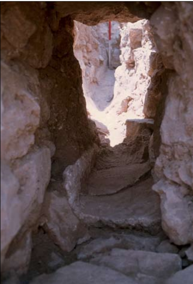
איור 3. תעלת ניקוז בשטח E.

בין המבנים הפרידו סמטאות צרות מדורגות שלפחות אחת מהן נחפרה. הבניה הצפופה על המדרון חייבה הקמה של מערכת ניקוז מפותחת. אחת מתעלות הניקוז נחפרה וישנן עדויות לקיומן של תעלות ניקוז נוספות.