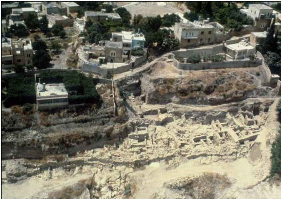
איור 1. שטח E בתום עונת 1984 -מבט מן האוויר.

ירושלים היא אולי האתר החפור ביותר בארץ. אמנם החפירות המדעיות -אלו שבהן התייחסו לרבדי העפר ולא רק לחציבות ולקירות ובעיקר קישרו בין הרבדים ובין הממצאים שנתגלו בכל אחד מהם- החלו רק בשנות השישים של המאה הקודמת עם החפירות של קתלין קניון.