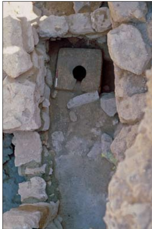
איור 7. תא שירותים משטח E.

הממצאים הרבים מן החפירה בירושלים של תקופת הברזל מאירים צדדים רבים של חיי היום יום. נציין נושא אחד חשוב - מתקני השירותים (Latrines). על פי הממצא על המדרון המזרחי של עיר דוד תא השרותים הירושלמי הוא פרטי, בניגוד למשל למנהג הרומי של הלטריות הציבוריות. הוא הורכב מאסלה מאבן ובור ספיגה. המתקן המוכר הוא זה הצמוד לבית אחיאל. תא זה נתגלה בחלקו הצפוני של שטח E. בנוסף נתגלו במהלך השנים עוד 3 או 4 אסלות ושני בורות ספיגה. שני מתקנים כאלו נתגלו באתרים של מצודות בקרבת ירושלים. המתקנים בירושלים נתגלו בבתים פרטיים בעוד שברבת עמון-