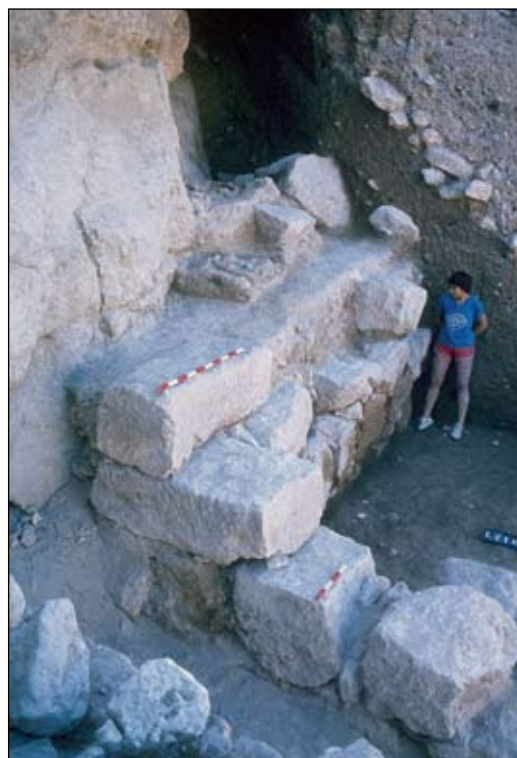
איור 5. הפינה הדרום-מערבית של מבנה הגזית בשטח E.