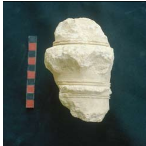
איור 6. שבר של מעקה חלון עשוי אבן משטח E

כאן המקום לבחון את תיארוכה של שכבה זו. לשם כך יש להתייחס למכלול החרסים שנתגלה בה. זהו המכלול המאפיין את אתרי יהודה בסוף תקופת הברזל. שכבה 10 חרבה בחורבן אלים הדומה לחורבן של אתרים בעלי מכלולים זהים, כמו שכבה II בלכיש. אפשר ליחס אותו בביטחון לחורבן הבבלי בידי נבוכדנצר בשנת 586 לפסה"נ. השאלה היא מה תאריך היסוד של שכבה זו או במלים אחרות - מתי מתחילה הפריחה הכלכלית של ירושלים ושל אתרים נוספים של ממלכת יהודה שנוסדו או נבנו מחדש בזמנם של מכלולי שכבה 10 בעיר דוד. מכלולי כלי חרס זהים לשכבה 10 בעיר דוד אנו מוצאים