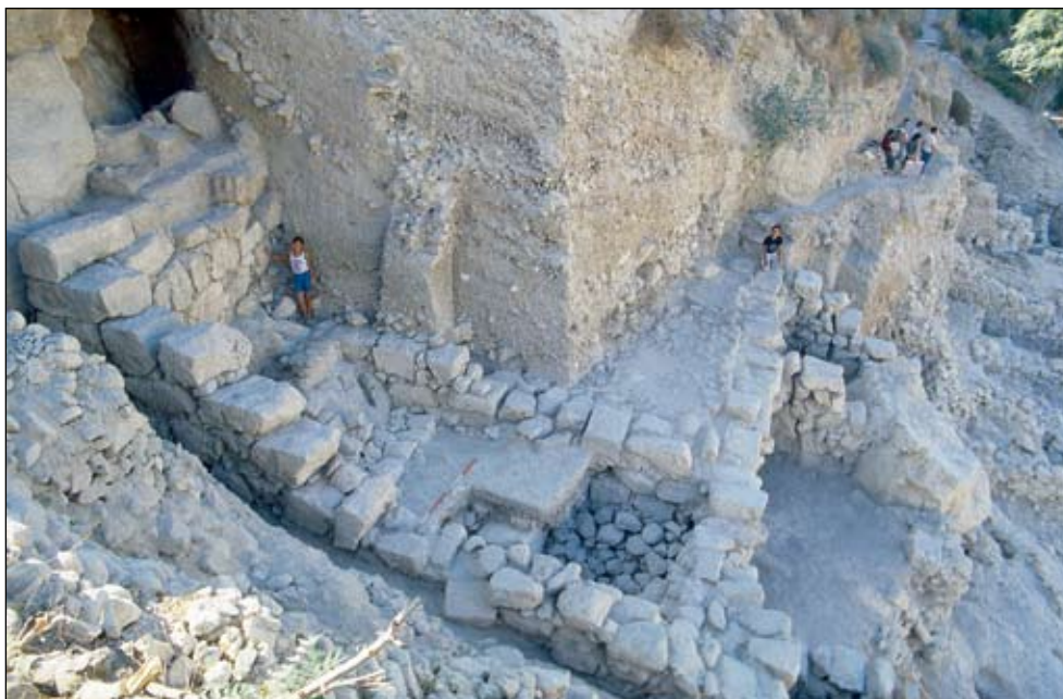
איור 4. מבנה הגזית בשטח E, מבט לצפון, עונת 1984.