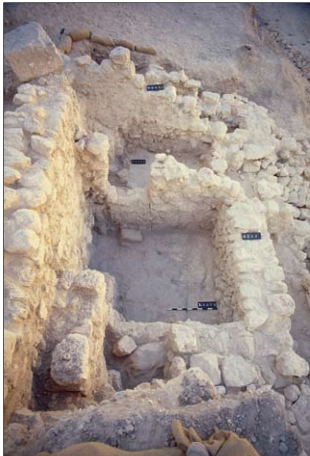
איור 2. שני חדרים במבנה מן השלב הקדום של המאה ה-8 לפסה"י. לחדרים הקטנים רצפות טיח (עונת 1979)